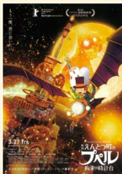
▲映画『えんとつ町のプペル 約束の時計台』