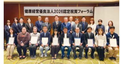
健康経営優良法人2026認定事業所の皆様