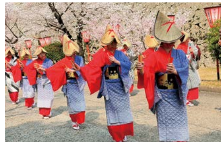
満開の鶴山公園にて

女性会では、地域の皆さまとのつながりを大切にしながら、受け継がれてきた津山の伝統文化を守り、次世代へとつないでいく活動を行っております。