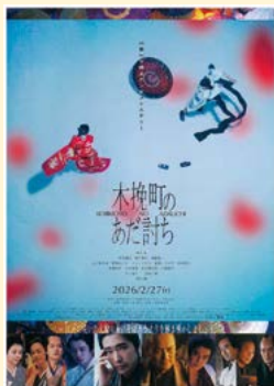
▲映画『木挽町のあだ討ち』