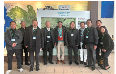
サントリー九州熊本工場にて

また、熊本名産の「馬肉料理」を通じて、古くから馬肉文化が根付く熊本 と、養生喰いの伝統を持つ「牛肉文化のまち・津山」との共通点や差異につい て考察を深めながら、地域特産品のブランド化や伝統食の提供スタイルを体感 しました。地場産品の付加価値向上や伝統的な食文化が、観光や地域活性化に 果たす役割について、異業種ならではの多角的な視点から学びを深めました。 今回の視察で得た先進事例を糧に、津山地域の食品産業のさらなる発展に寄与 してまいります。