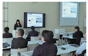
研究内容発表会の様子

第33期においては、労働・教育・人材育成委員会が中心となり、引き続き津山高専との連携を継続してまいります。