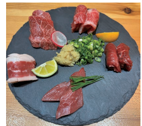
熊本名産 馬肉料理