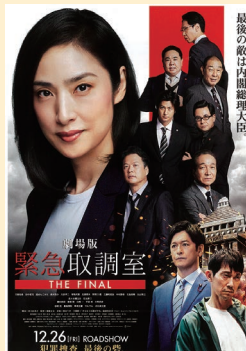
▲映画『劇場版 緊急取調室 THE FINAL』