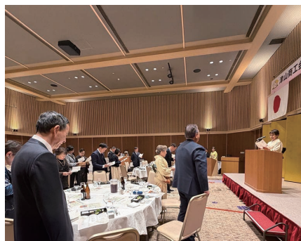
市民憲章を唱和する一同