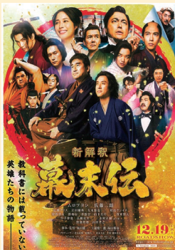
▲映画『新解釈・幕末伝』