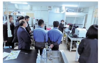
化学実験室の視察の様子