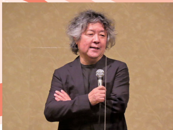
脳科学者 茂木 健一郎 氏

新型コロナウイルス感染症の影響により延期していた新春講演会を、津山商工会議所特別講演会(担当:地方創生推進委員会)として津山鶴山ホテルにて開催しました。