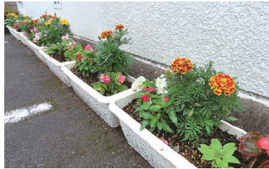
笹井社会保険労務士事務所 津山市山下5

今回プレゼントした花の苗は、会社やお店の前の花壇・プランターに植えられ、見る人を楽しませていきます。