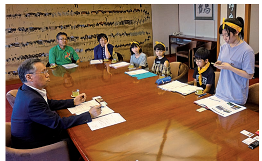
谷口津山市長に活動報告をする ひまわり大使の子供たち(2019年)

また、2019年には福島から4人の子ども達『ひまわり大使』が津山を訪れ、活動報告をしました。