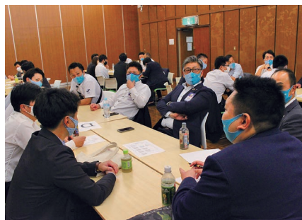
ディスカッションの様子