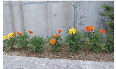
JEWELRY KANDA 津山市川崎 1902-3