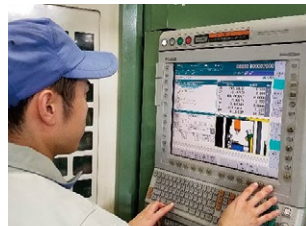
【対向軸複合加工機】 ロード付き5軸複合加工機で24時間連続運転。