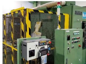
【縦型複合加工機】 5軸制御による精密加工で複雑な形状も1チャックで加工。