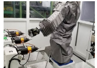
【バリ取りシステム】 ロボットによるバリ取りを可能にし、無人化、省人化。