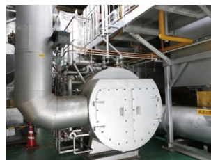
【原動設備】 電気やエアなどのエネルギーを工場に安定供給しています。