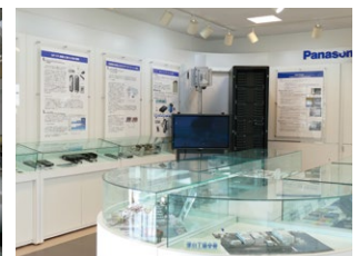
【会社エントランス】 工場の沿革や製品特徴、歴代製品などを展示しています。