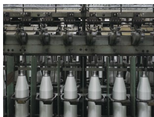
【シートベルト】 シートベルト用糸の燃糸加工機