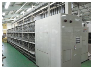
【仮燃機】 生地のはつれ止用糸の加工機