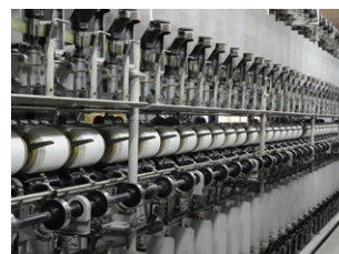
【ミシン糸】 50番手本縫ミシン糸の燃糸加工機