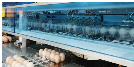
【卵選別包装システムSKYシリーズ】

本社工場で製造を行っているSKYシリーズは衛生を徹底的に追求した鶏卵の洗卵選別包装システム。卵を搬送するキャリアカップの自動洗浄機能を世界で初めて搭載し、卵の計量部の水洗い対応や、洗卵部・乾燥部装置内の自動泡洗浄を可能にした。また、汚卵・ひび卵・血卵などの不良卵を検出する高性能自動検出装置も装備可能となっており、鶏卵流通の要であるGPセンター（鶏卵の洗卵選別包装施設）で、安全安心で高品質な卵の生産を支援している。