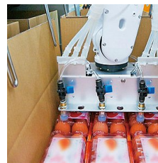
【パック卵自動箱詰めロボット】

本社工場で製造を行っているSKYシリーズは衛生を徹底的に追求した鶏卵の洗卵選別包装システム。卵を搬送するキャリアカップの自動洗浄機能を世界で初めて搭載し、卵の計量部の水洗い対応や、洗卵部・乾燥部装置内の自動泡洗浄を可能にした。また、汚卵・ひび卵・血卵などの不良卵を検出する高性能自動検出装置も装備可能となっており、鶏卵流通の要であるGPセンター（鶏卵の洗卵選別包装施設）で、安全安心で高品質な卵の生産を支援している。