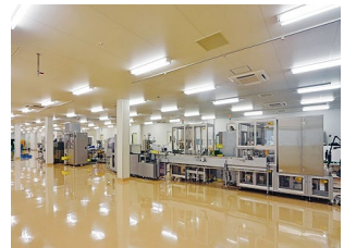
【PTP包装ライン】 最終包装までを一貫して行う最新鋭の設備