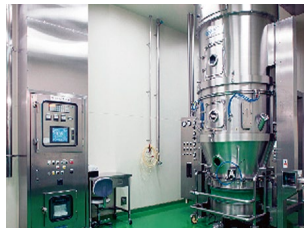
【流動層造粒乾燥機】 さまざまな造粒方法・適正スケールに対応