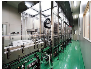
【充填機】 クラス100相当の無菌環境下での充填が可能