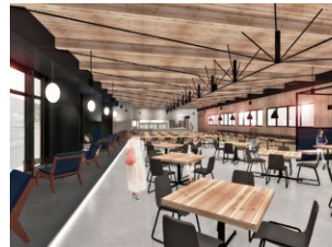
【社員食堂(AIDINING)】 食事の面から健康づくりをサポート