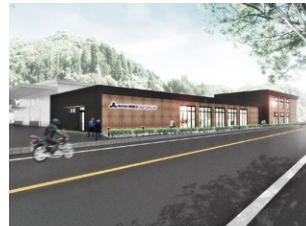
【社員食堂、スポーツジム棟】 社員の「食」「運動」「心」を支援