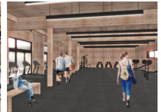
【スポーツジム棟(AIDOJO)】 からだの健康づくりをサポート